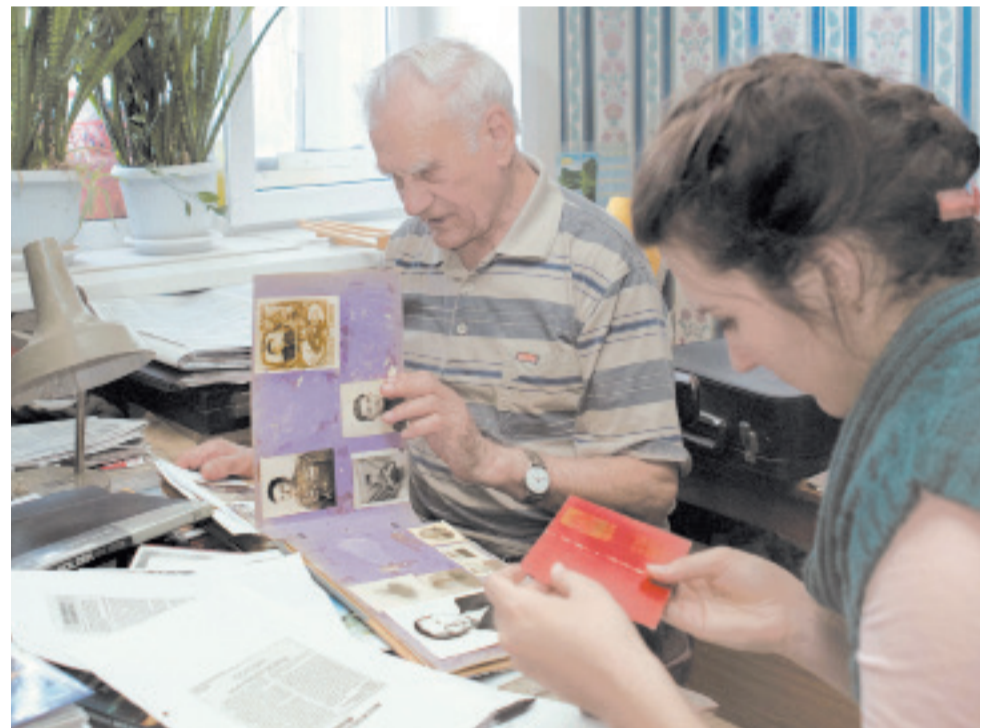
В гостях у ветерана