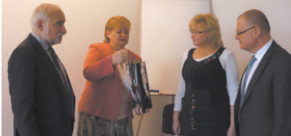
Члены делегации СамГТУ с представителями Высшей школы Денниса Габора (Венгрия)

Студенты СамГТУ смогут получить диплом международного образца