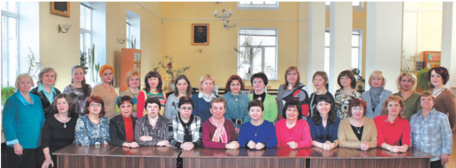
Библиотека на 20 лет моложе университета. Много это или мало, судить вам. Каждый период времени накладывал свой отпечаток на состояние её фондов, интересы пользователей, содержание работы.

В 30-е гг. XX в. существовали самостоятельные библиотеки при трех институтах г. Самары: Механическом, Энергетическом, Химическом. 3 мая 1934 г. был подписан приказ о создании единой фундаментальной библиотеки, которая обеспечивала бы учебную и научную работу в Средневолжском индустриальном институте на базе слияния отраслевых библиотек вузов. Именно с этой даты начинается история нашей библиотеки.